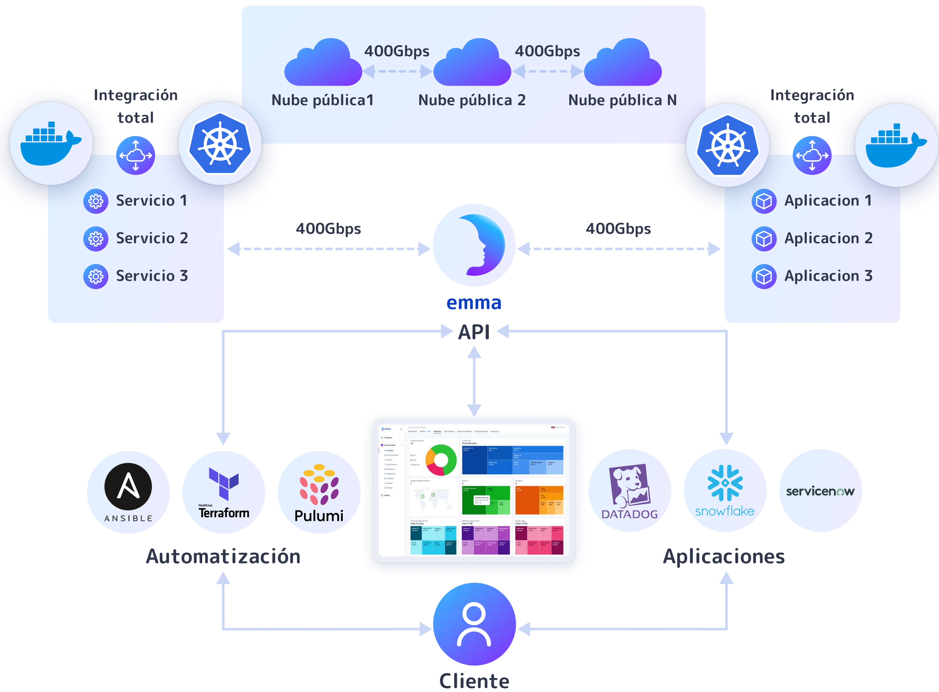
Diagrama de arquitectura de alto nivel de la plataforma